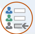
Ordini di Stampe